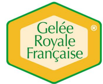
Groupement des Producteurs de Gelée Royale